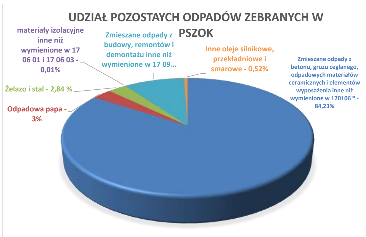
Rysunek 5 Struktura pozostałych odpadów zebranych w PSZOK w 2025 r.

Na wykresie poniżej graficzne zestawienie udziału poszczególnych frakcji odpadów innych niż komunalne zebranych w PSZOK w 2025 r.