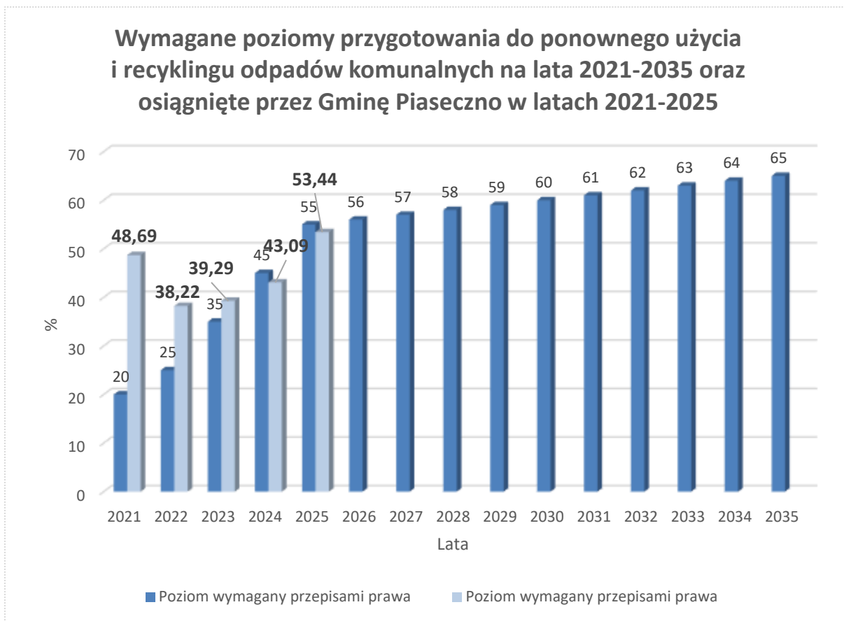
Rysunek 6. Wymagane poziomy przygotowania do ponownego użycia i recyklingu odpadów komunalnych na lata 2021-2035 oraz osiągnięte przez Gminę Piaseczno w latach 2021-2025.

Jak wynika z powyższego wykresu w roku 2025 Gmina Piaseczno nie osiągnęła określonego ustawą poziom przygotowania do ponownego użycia i recyklingu odpadów komunalnych.