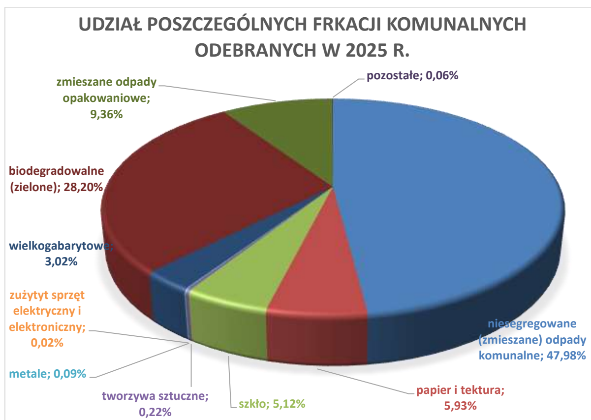
Rysunek 3. Struktura odpadów komunalnych odebranych z terenu miasta i gminy Piaseczno w 2025 r.

Poniżej graficzne zestawienie udziału poszczególnych frakcji odpadów w odpadach odebranych bezpośrednio z nieruchomości zamieszkałych, mieszanych i niezamieszkałych. Ze względu na przejrzystość wykresu odpady pogrupowano we frakcje o zbliżonym charakterze.